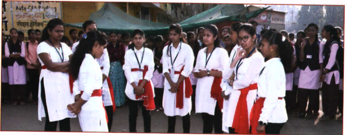
शिवाजी विद्यापीठ मानसशास्त्र परिषद आणि तरुणाई... एक हृदयसंवाद कार्यक्रमावेळी पथनाट्य सादर करताना मालती वसंतदादा पाटील कन्या महाविद्यालय इस्लामपूरच्या विद्यार्थिनी.

शिवाजी विद्यापीठ मानसशास्त्र परिषद पाचवे राज्यस्तरीय व तेरावे विद्यापीठस्तरीय वार्षिक अधिवेशन 2019 स्मरणिका