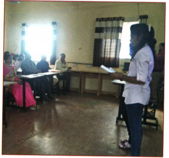
शिवाजी विद्यापीठ मानसशास्त्र परिषद अधिवेशनाच्या निमित्ताने पेपर प्रेझेंटेशन करताना विद्यार्थिनी.