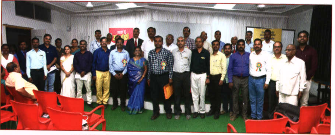
शिवाजी विद्यापीठ मानसशास्त्र परिषद विद्यमान कार्यकारीणी मंडळ व मान्यवर