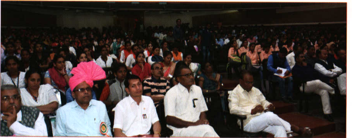
शिवाजी विद्यापीठ मानसशास्त्र परिषद आणि तरुणाई... एक हृदयसंवाद कार्यक्रमास उपस्थित प्राध्यापक वर्ग